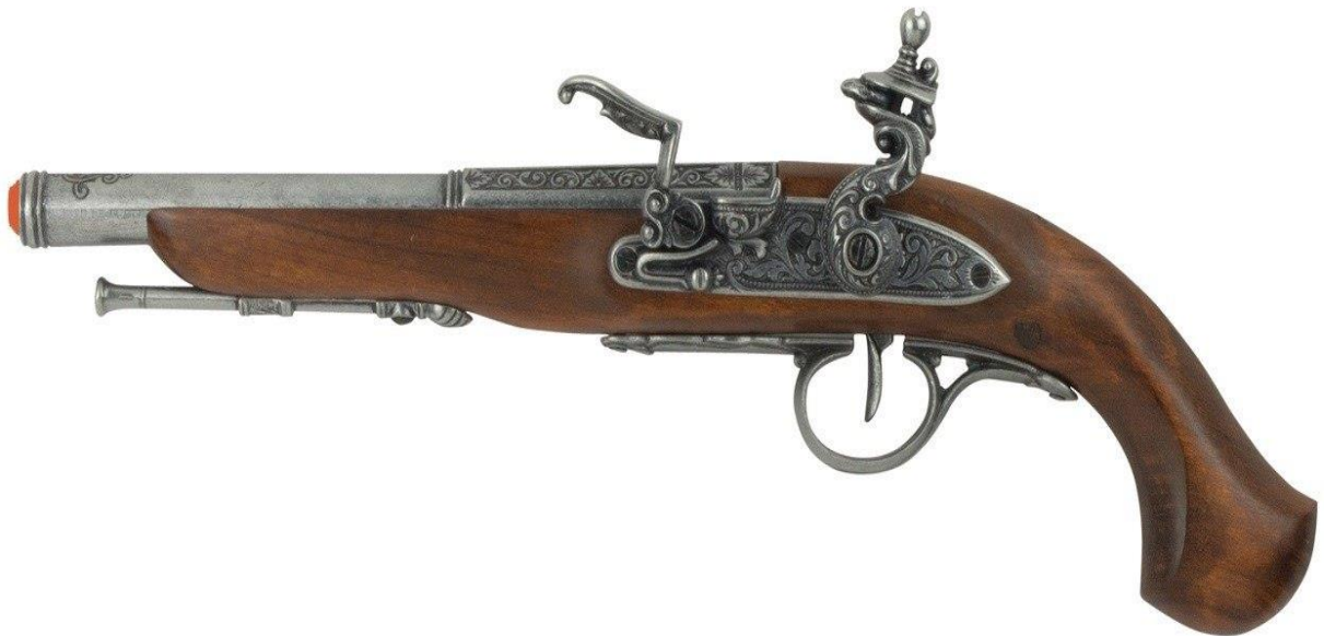
Կայծքարե ատրճանակ, 18-րդ դ.

հրացանը գործածվում էր XVII դարի երկրորդ կեսից ի վեր: XVIII դարի սկզբին այն արդեն հիմնականում փոխարինել էր իր նախորդին՝ պատրոյգավոր հրացանին (мушкет, аркебуза) 1 : Կայծքարե հրացանը բավականին թանկարժեք զենք էր. Արևմտյան Եվրոպայում նրա գինը հավասար էր գյուղաշխատողի տարեկան ընդհանուր վարձին 2 : Եվրոպական պետություններում պատրոյգավոր հրացանները կայծքարայիններով փոխարինվել են հիմնականում 1690-ական թթ. մինչև 1715 թ. ընկած ժամանակահատվածում. Ավստրիայում՝ 1689 թ., Շվեդիայում՝ սկսած 1696 թ., Հոլանդիայում և Անգլիայում՝ մինչև 1700 թ., Ֆրանսիայում՝ մինչև 1703 թ., Ռուսաստանում՝ մինչև 1715 թ. 3 :