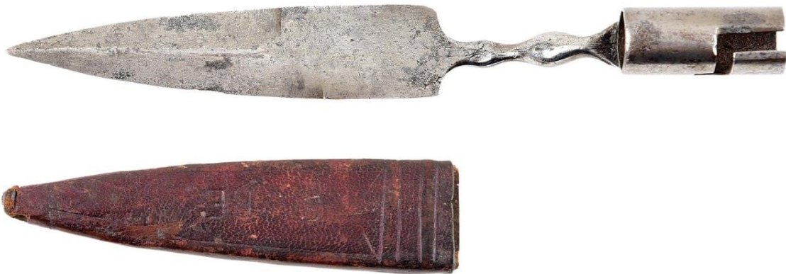
Փակցնովի սվին, 18-րդ դ.

Նախ, սկզբնաղբյուրներում խոսք չկա Սղնախներում նիզակներ արտադրելու կամ գործածելու մասին: Ինչպես վերը նշվեց, Սղնախների «ռազմարդյունաբերությունը» պատրաստում էր «հրացաններ, սրեր, կարճ թրեր, դաշույններ, ատրճանակներ» (пищали, сабли, тесаки, кинжалы, пистолеты) 1 : Ռուսերեն «тесак» (կարճ, լայնաշեղք թուր) բառով նշված զինատեսակը կարող էր լինել նաև սվինի մի տարատեսակ, որը հրացանի փողին հարմարեցվելու դեպքում Ռուսաստանում կոչվում էր «багинет» (բառն առաջացել է ֆրանսերեն baionette-ից): Այսինքն, միանգամայն հավանական է, որ լայնաշեղք սվինները միաժամանակ ծառայած լինեն նաև որպես սվիններ: Այսպես՝ 1715 թ. արտադրված ռուսական կայծքարե հրացաններն ունեին հենց այդպիսի լայնաշեղք սվիններ՝ «штык с клинком тесачного типа» 2 :