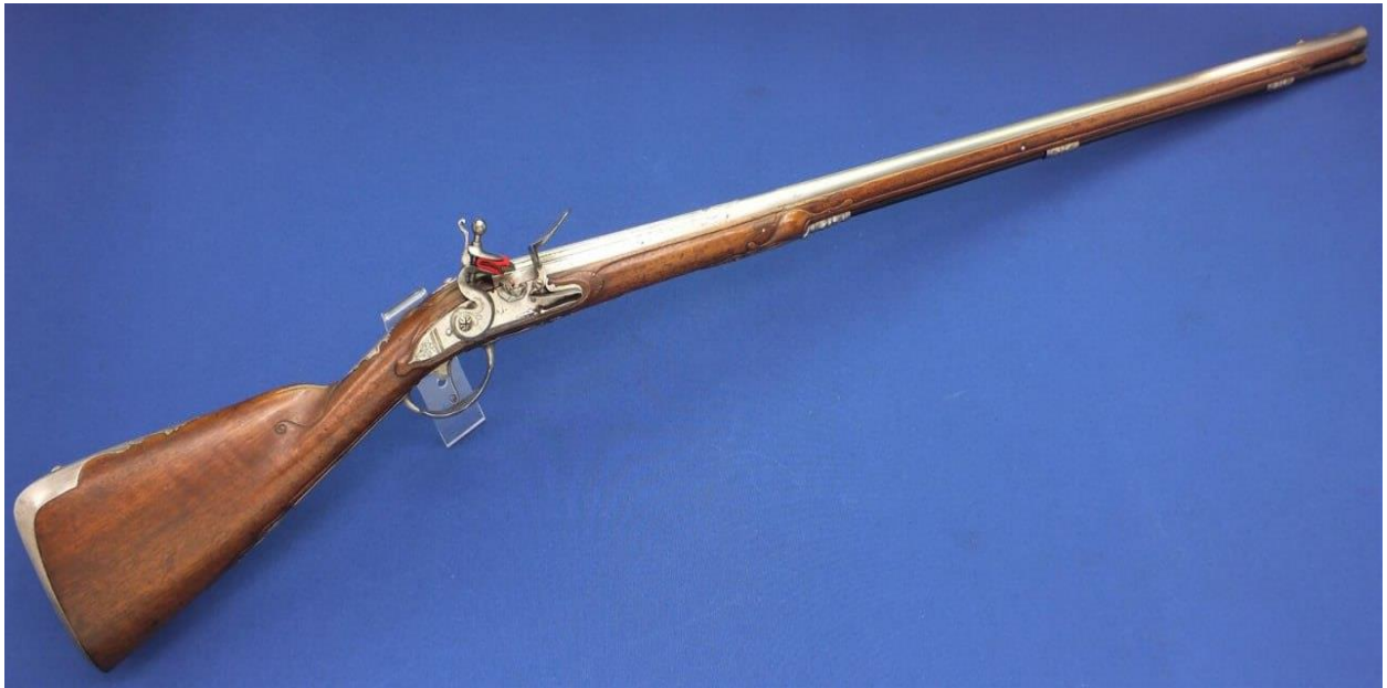
Կայծքարե հրացան, 18-րդ դ.

Այս հաղորդման ռուսերեն թարգմանությունը լրացուցիչ պարզություն է մտցնում. «Здесь войско так изрядно, что я такого во всей Персии не видел, 12 тысяч конных с огненным ружьем, а пехоты с ружьем же огненным множество. И ружья еще здесь в прибавку делается по 10 фузей на день» 1 : Ռուսերեն «огненное ружье»-ն «фузея»-ի հոմանիշն է, որը նույնպես նշանակում է կայծքարե հրացան: «Фузея» բառը ծագում է ֆրանսերեն fusil-ից, որը նշանակում է «հրահան»: